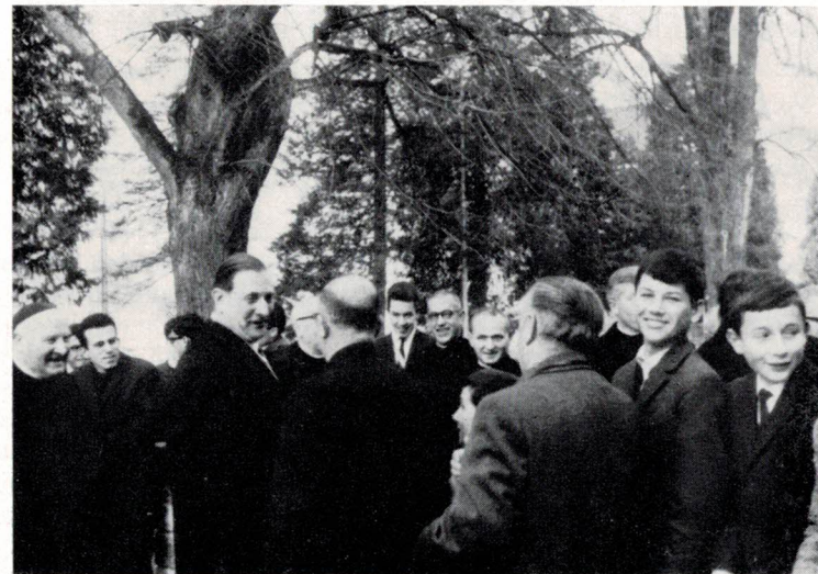
Beim Besuch des Bundespräsidenten im Kollegium